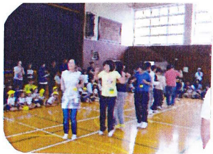
クラス対抗大縄大会 たった1分間が とっても長い〜1分でした

随分詳細な検討をして準備をして頂く一方、予約販売や売店も手際よく対応して頂きました本部役員さんをはじめ、PTA役員の方々に感謝申し上げます。ありがとうございました。