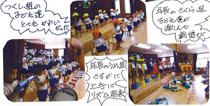
つくし組の 子ども達 とてもかわいい おたけ